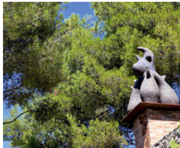
ST Paul de Vence

« Alors, ce master, il sert à quoi ? » demandait une étudiante la semaine dernière. Les for-