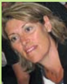
→ par Gisèle Jean, responsable du collectif FDE

La rentrée 2011 s'annonce sous le signe de nouveaux reculs sur la formation des enseignants et « d'innovations » visant à pallier au déficit en enseignants.