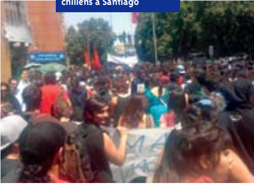
Manifestation d'étudiants chiliens à Santiago

mérites en 2010, avec photos glamour à l'appui, et une fête pour les nouveaux diplômés, dont la pub souligne le « look parfait ». Les droits d'inscription vont de quelques centaines à quelques milliers de dollars ; 3,5 millions de pesos par an pour la fac de médecine. Dans la rue, les étudiants les moins fortunés font la manche... Le Chili avait jadis un service public d'enseignement supérieur modèle pour l'Amérique latine et les enseignants un statut béton. Tout cela a été liquidé. L'enseignement est « municipalisé » depuis plus de vingt ans, forme chilienne de la privatisation. Les salaires sont liés au « rendement »... Le gouvernement promet une nouvelle réforme, « consensuée » avec le parti socialiste et la démocratie chrétienne ; une « revolución » selon le président Piñera, et le « coup de grâce » selon les syndicalistes. ●