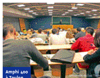
Amphi 400 à Toulon

donc comme un renoncement à toute ambition en matière d'amélioration de la réussite des étudiants, d'autant qu'elle s'accompagne d'un maintien du dogme du gel de l'emploi public pour l'enseignement supérieur. Cette fois-ci, plus question d'afficher des objectifs précis d'amélioration de la réussite en licence. La communication se déplace sur un autre front en inscrivant maintenant en haut de l'affiche la volonté de faire de la licence « un diplôme pour l'emploi ». On évite cependant de justifier ce choix : y aurait-il un réel problème d'insertion professionnelle pour les étudiants sortant de formation avec la licence pour plus haut diplôme obtenu ? Des enquêtes récentes (1) prouvent le contraire : pour les étudiants sortant de formation avec une licence générale, le taux de chômage est de 7 %, chiffre plutôt bon com-