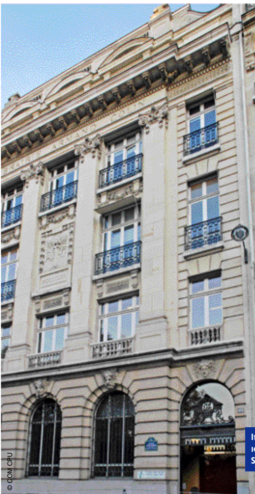
Immeuble de la CPU : 103, boulevard Saint-Michel à Paris

Cette prise de contact a été l'occasion de percevoir la disparité de vues au sein du bureau de la CPU, chargé de représenter les présidents d'universités. ●