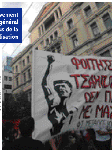
Un mouvement général de refus de la marchandisation

Le 19 janvier le CDFN de la FSU a décidé « d'entreprendre les démarches d'adhésion de la FSU à la CES » : 83,5 % pour, 13,5 % contre, 3 % abstentions. En dehors de ces exprimés, il y a eu 20 % de « Ne prend pas part au vote ». La majorité requise lors d'un vote du CDFN est de 70 % de « pour » sur l'ensemble des votes exprimés. Le SNESUP a réparti ses voix en deux « pour », 1 abstention et 1 « contre ». Le 14 janvier, la CAN du SNESUP avait voté en faveur de l'adhésion – 17 pour, 11 contre, 5 abstentions – sur la base d'un texte précisant les motivations et le mandat. http://www.snesup.fr , saisir CES dans les mots-clés. ●