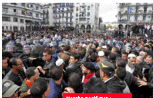
Marche pacifique : Alger, 12 février 2011

objectif l'amélioration des conditions socio-économiques sans but politique. Malgré cela, le pouvoir les considère comme des ennemis à combattre par tous les moyens. Ce comportement est devenu possible grâce au soutien du pouvoir français en général et de Sarkozy en particulier qui a préféré le statu