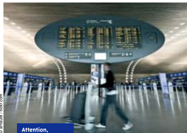
Attention, zone d'expulsions

À la différence du TS « salarié », ce TS expire systématiquement à la date de fin du contrat de travail. Il ne peut être renouvelé sans un nouveau contrat avec un organisme de recherche agréé. Deux consé-