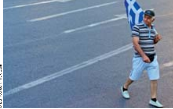
Une population à bout

amphis surchargés et les TD ne sont plus assurés. Les élèves n'ont toujours pas reçu leurs livres scolaires et certaines écoles ferment pour quelques jours, car sans chauffage... Hérodote passe mal ! La Grèce, pays qui a vu naître le mot démocratie, se trouve aujourd'hui mise au pas par la Troïka et perd sa souveraineté. La mise en place du MES (Mécanisme européen de stabilité) sera la suite de l'expérience grecque appliquée à l'Europe entière. Comment dans ces conditions, développer, indépendamment des pressions émanant des forces politiques, économiques et religieuses, et au service des besoins sociaux du XXI e siècle, une politique de recherche et d'enseignement supérieur public permettant l'émancipation pour tous ? ●