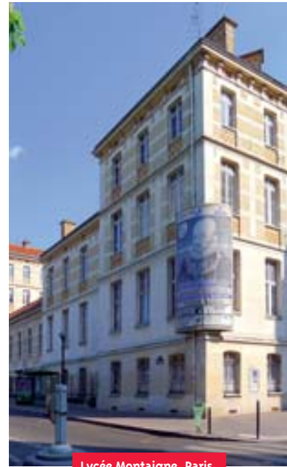
Lycée Montaigne, Paris.

ment situées, requéraient plus de capital scolaire sous APB qu'avec Ravel, l'inaccessibilité de certaines filières étant moins évidente (le choix pouvait être formulé même s'il était impossible qu'il soit satisfait). Malgré ces limites, il reste qu'APB constituait une harmonisation à l'échelle nationale des possibilités offertes aux candidats. La priorité académique, liée au Code de l'éducation, était une des limites principales du système APB en Île-de-France, le tirage au sort entre les bacheliers permettant en principe d'assurer une certaine « mixité » sociale et scolaire. Cet accès inégal aux formations dites « non sélectives » universitaires, qui relevait à la fois de critères géographiques (secteur, académie) et sociaux (construction de stratégies), pose in fine la question de l'offre