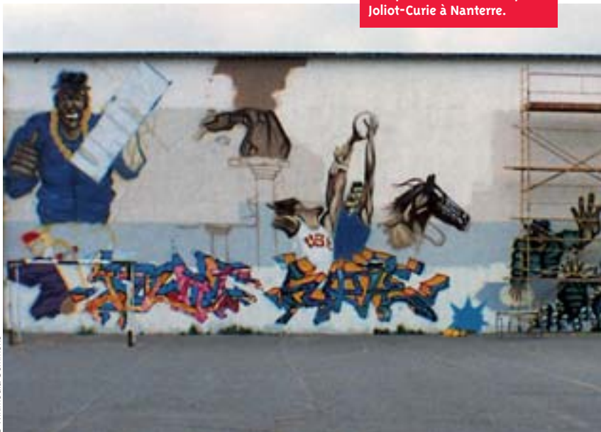
Fresque à l'intérieur du lycée Joliot-Curie à Nanterre.

La réforme en cours propose de supprimer la priorité académique, ce qui peut être analysé comme un assouplissement supplémentaire de la « sectorisation » des affectations pour les filières dites « non sélectives » de l'université. L'autorité académique pourra cependant fixer un pourcentage maximal d'affectations extra-académiques pour éviter l'engorgement de certaines filières. Comment ce pourcentage sera-t-il fixé ? Sera-t-il variable selon les filières, les académies et les années ? Comment les bacheliers pourront-ils alors anticiper leur chance d'être acceptés dans une filière d'une académie qui n'est pas celle où ils ont passé leur baccalauréat ? D'autres éléments de la réforme, comme la régionalisation de la carte des formations (et des capacités d'accueil), la différenciation accrue des offres de formations supérieures (« attendus » qui seront définis par les filières, comme les modalités de remédiation pédagogique pour les « oui si ») et l'encadrement plus fort des choix des bacheliers suivant l'avis du conseil de classe de terminale, contribueront à dessiner un paysage des transitions secondaire-supérieur plus complexe et plus différencié. Les transformations en cours se traduiront sans doute par de nouvelles inégalités d'accès qu'il faut lire dans leur dimension spatiale pour souligner ainsi le poids des inégalités sociales dans les trajectoires scolaires. ●