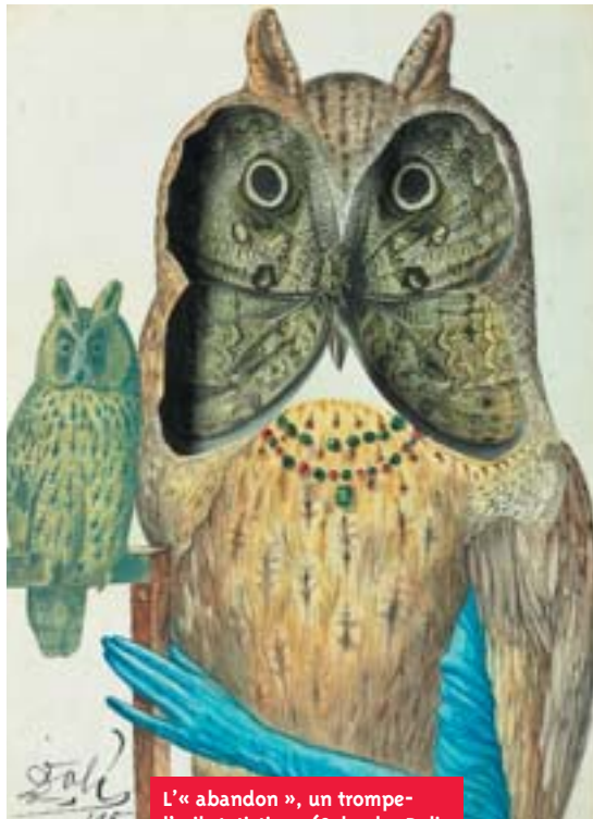
L'« abandon », un trompe-l'œil statistique (Salvador Dalí, Trompe-l'œil , 1950).

L'Université ne sélectionnant pas à son entrée, elle accueillerait de fait des étudiants majoritairement inscrits par défaut, et souvent plus fragiles scolairement (notamment les bacheliers technologiques et professionnels). L'accès de droit à l'Université qui est conféré à tout bachelier ne signifie pas pour autant l'usage de ce droit par tous les bacheliers. En effet, malgré leur caractère ouvert, les licences universitaires ne sont pas les formations qui accueillent en plus forte proportion ceux que l'on peut considérer comme les minorités de l'enseignement supérieur, à savoir les bacheliers technologiques et professionnels, ainsi que les bacheliers d'origine populaire (enfants