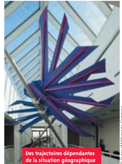
Des trajectoires dépendantes de la situation géographique – œuvre de Joëlle Morosoli.

À la suite d'autres travaux, comme ceux de S. Orange, cette thèse montre les logiques collectives dans les orientations étudiantes, dont la dimension spatiale se cristallise autour du lieu de scolarisation. Les liens préférentiels entre certains lycées et certaines formations du supérieur dessinent des circuits de scolarisation révélés tant par l'enquête par entretiens que par un travail cartographique sur les flux entre lycées et universités (candidatures APB 2011). Mais les démarches collectives d'orientation caractérisent plus particulièrement les milieux populaires, ce qui invite à explorer les facteurs sociaux (toujours spatiaux) d'une différenciation des inscriptions vers l'une ou l'autre des universités franciliennes. Les trajectoires étudiantes dévoilent alors un « sens du placement » universitaire, qui peut se lire dans les rapports aux études, mais aussi plus clairement dans les stratégies universitaires que ces rapports aux (lieux d') études permettent de construire. Cela se traduit concrètement par des stratégies d'évitement, un